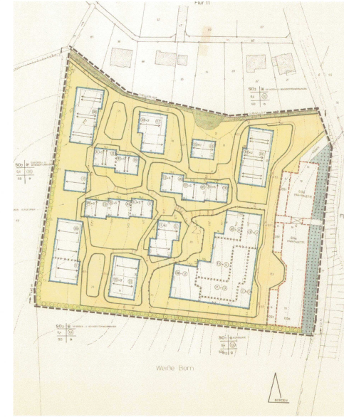
Ausschnitt aus dem Bebauungsplan Nr. 9 (Urschrift von 1983)